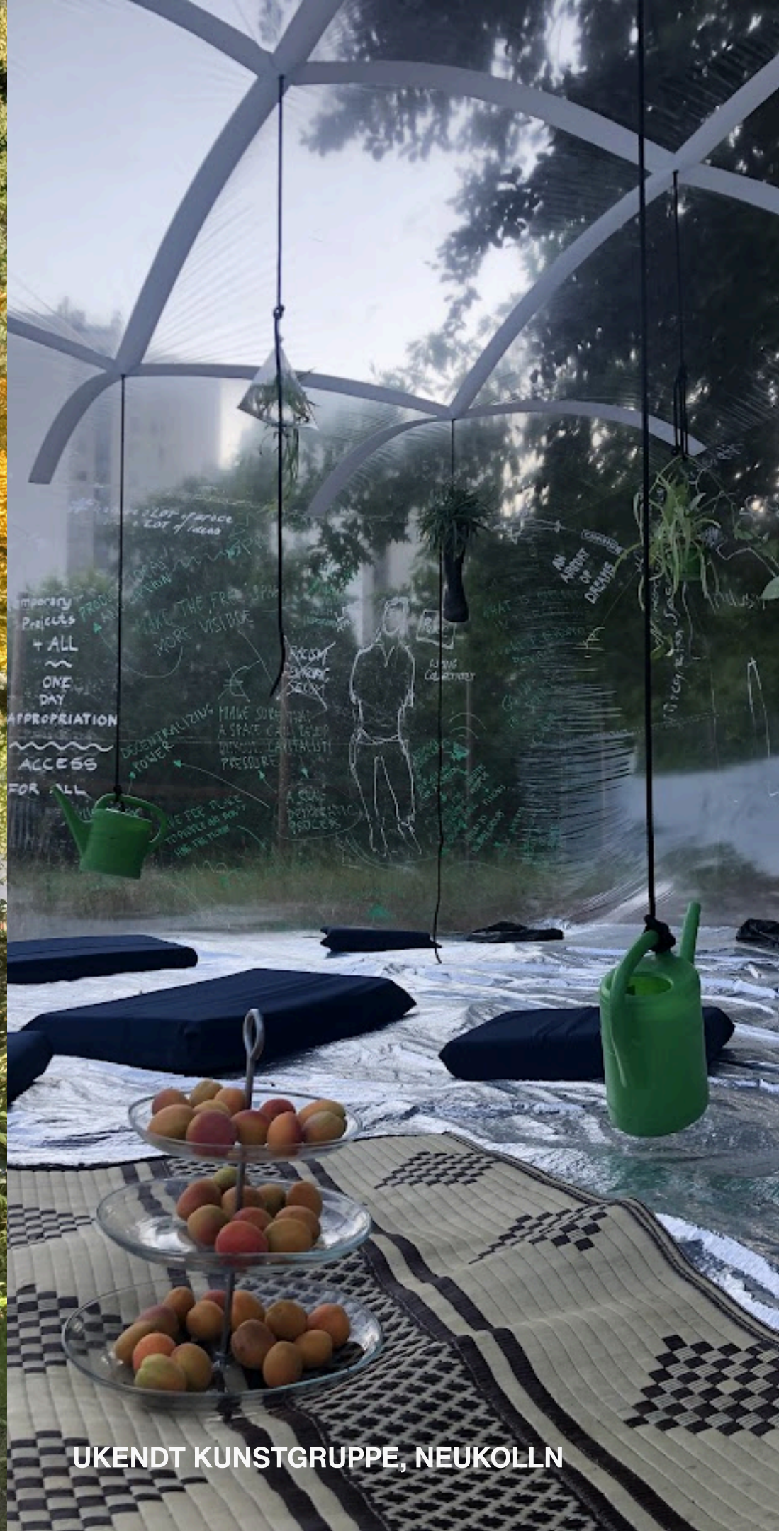
UKENDT KUNSTGRUPPE, NEUKOLLN