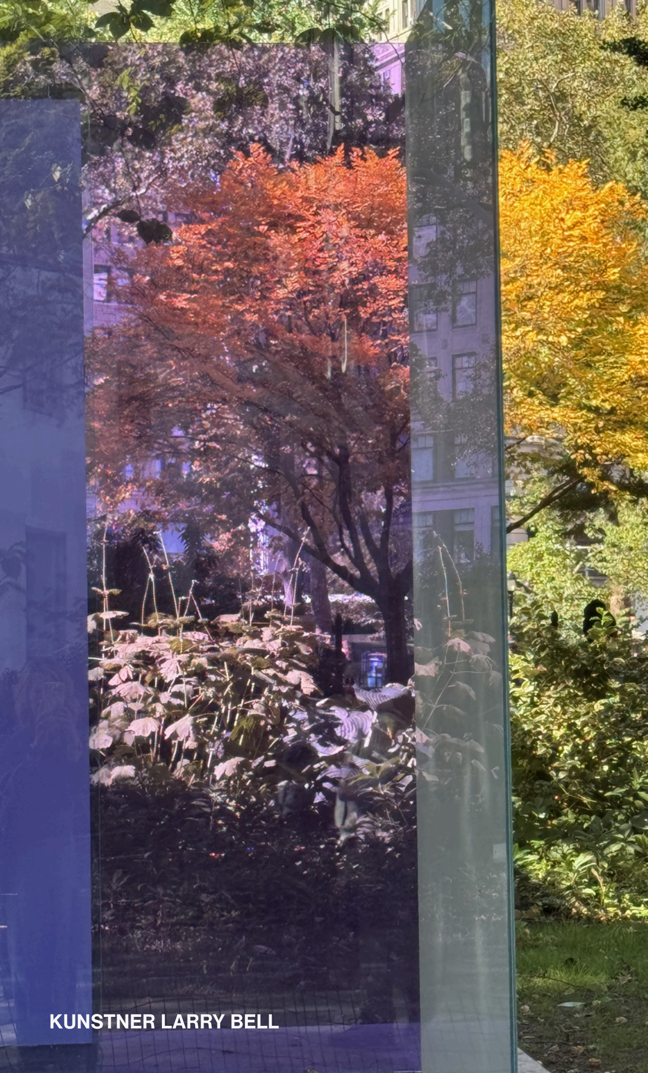
KUNSTNER LARRY BELL