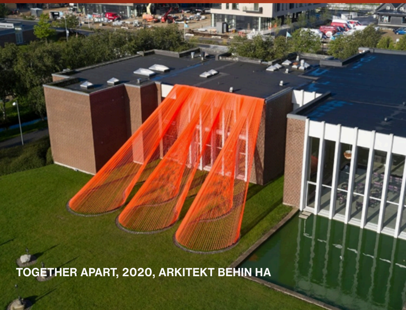
TOGETHER APART, 2020, ARKITEKT BEHIN HA