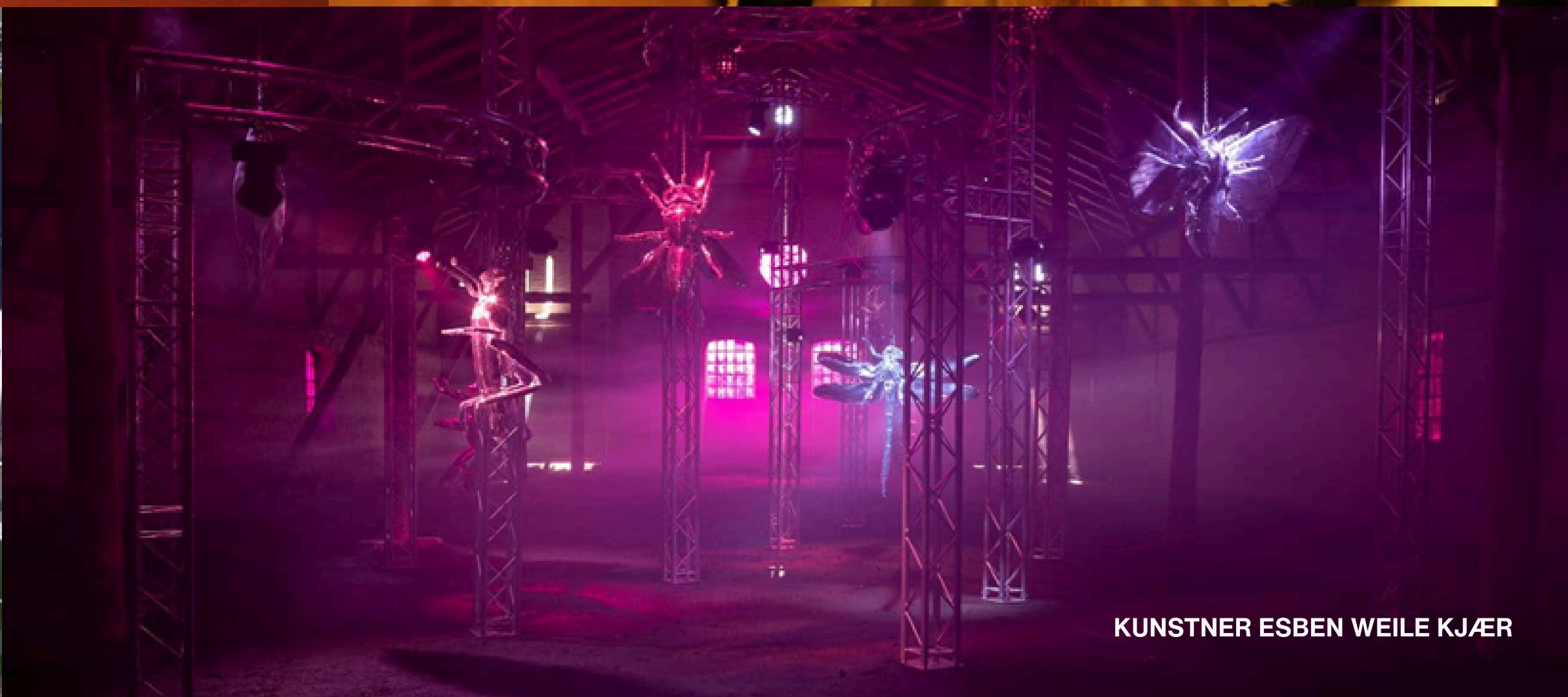
KUNSTNER ESSEN WEILE KJÆR